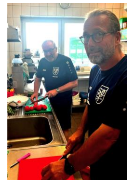
Jugend- und Herrenobmann bei der Essensvorbereitung